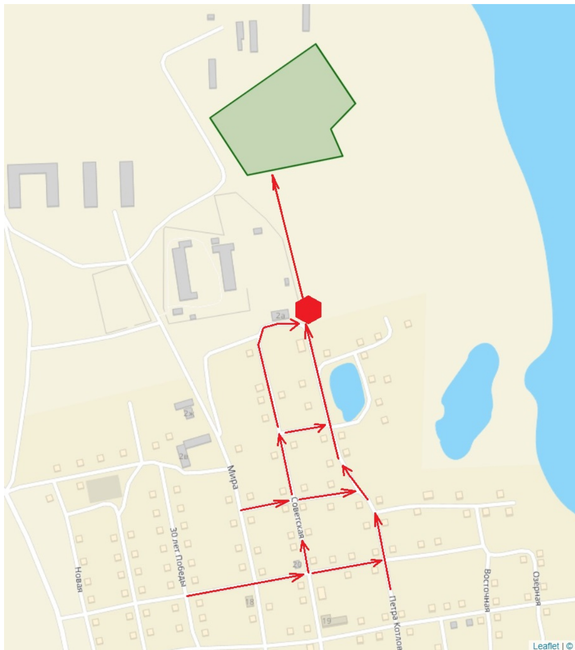
Схема прогона сельскохозяйственных животных на территории Селезянского сельского поселения Еткульского муниципального района Челябинской области с. Селезян